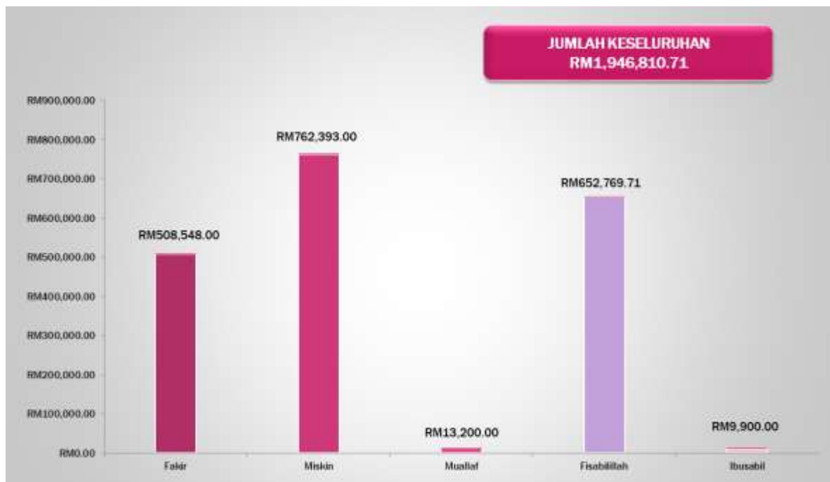
Rajah 1: Laporan agihan zakat mengikut lima kategori asnaf di UPM tahun 2018

Lokasi kajian yang dijalankan adalah di Universiti Putra Malaysia (UPM). UPM dipilih kerana ia mempunyai institusi pusat zakat peringkat universiti yang paling sistematik dan aktif. Responden kajian ini adalah pelajar yang mendapat bantuan zakat fisabilillah dari Pusat Zakat UPM. Pemilihan responden adalah secara persampelan rawak mudah. Persampelan sistematik tidak dapat dilakukan kerana penyelidik tidak mendapat senarai nama lengkap pelajar fisabilillah ini kerana ianya adalah rahsia. Sebanyak RM652,769.71 diperuntukkan untuk pelajar fisabilillah. Ia merupakan peruntukan yang kedua tinggi selepas peruntukan untuk pelajar miskin. Oleh itu, penyelidik mengedarkan sebanyak 250 borang soal selidik kepada pelajar UPM yang pernah mendapat zakat fisabilillah.